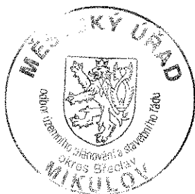
Olga Ondrašíková odborný zaměstnanec

Proti tomuto rozhodnutí se mohou podle § 81 odst. 1) správního řádu účastníci řízení odvolat do 15 dnů (§ 83 odst. 1 správního řádu) ode dne jeho oznámení. Odvolání podle § 82 odst. 2) správního řádu se podává u zdejšího stavebního úřadu s potřebným počtem stejnopisů, tak aby jeden stejnopis zůstal stavebnímu úřadu a každý účastník dostal jeden stejnopis. Odvolání bude postoupeno odboru územního plánování a stavebního řádu, Krajského úřadu Jihomoravského kraje v Brně.