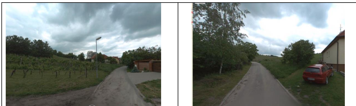
Plocha 3.1b BV a 3.1UP