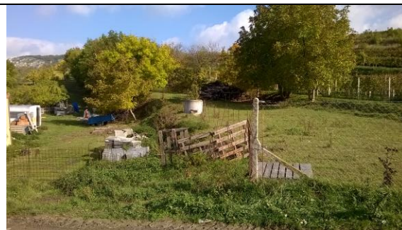
Plocha 3.2 BV a navazující 3.1b UP